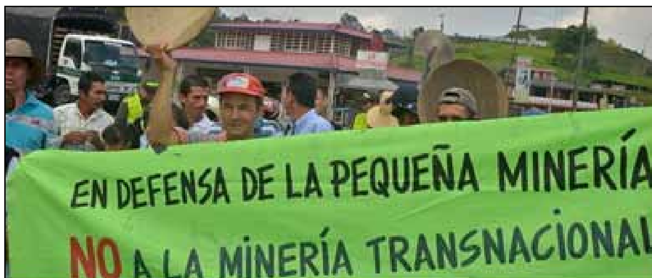
Pancarta publicada por El Colombia, sábado 14 de julio de 2013.

En la mitad entre los dirigentes que decidieron renunciar a ejercer soberanía en Colombia y quienes hemos advertido del desastre de este modelo minero-energético al servicio de intereses foráneos, están cientos de miles de colombianos que históricamente han realizado minería de manera artesanal y en pequeña escala e incluso -como resultado de la tecnificación- de manera mecanizada. Al ser un obstáculo para que la gran minería transnacional inicie sus proyectos, el Gobierno Nacional ha lidera-